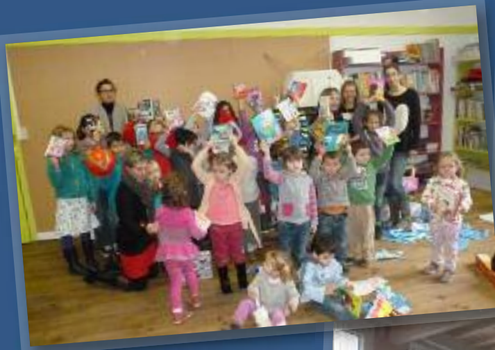
Le Noël de l'école