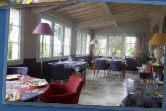
La Sabatère, nouveau restaurant à Lupiac