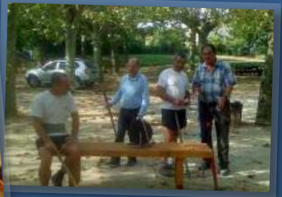
Les nouveaux bancs du foirail