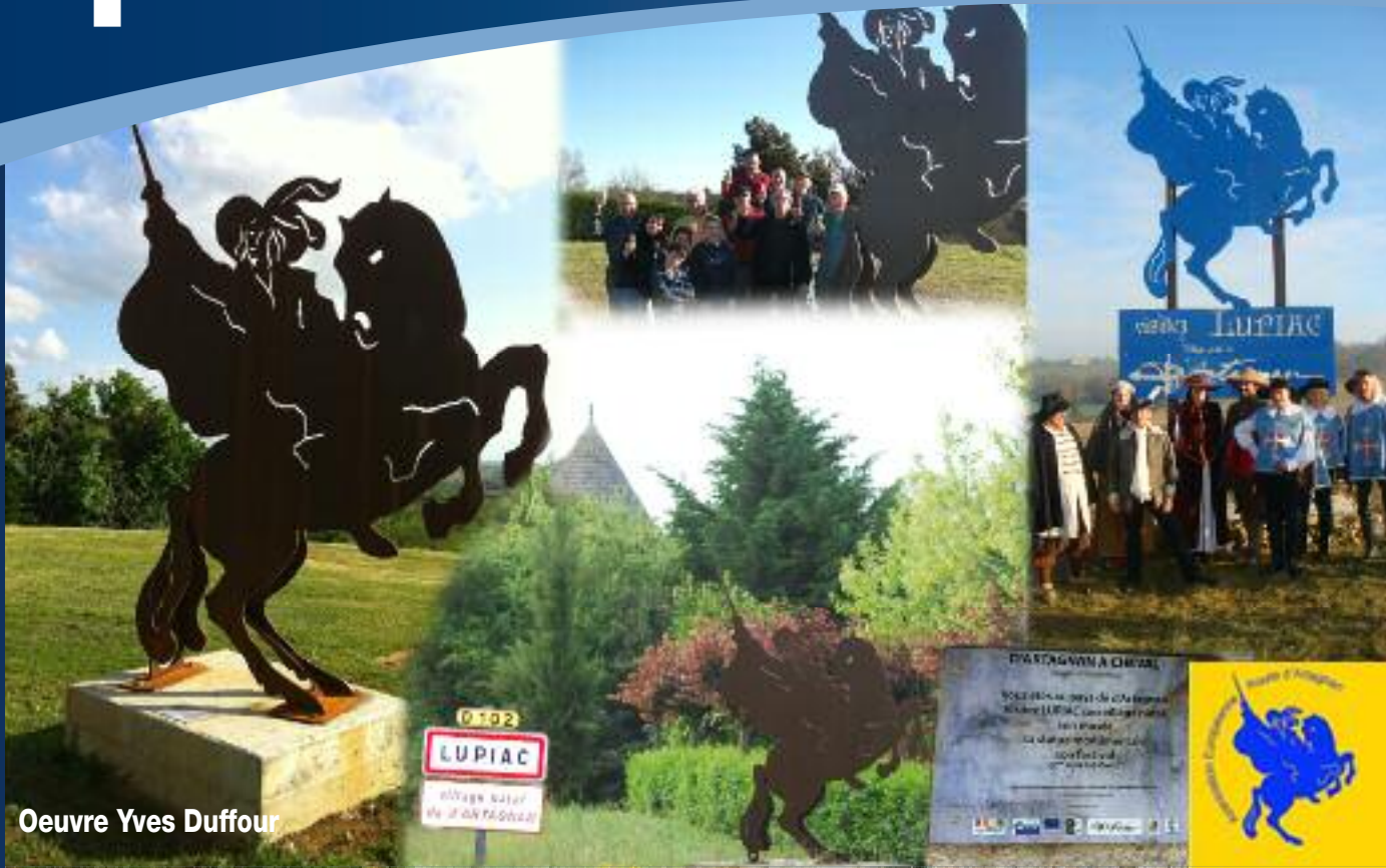
Oeuvre Yves Duffour