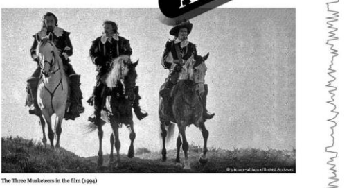
The Three Musketeers in the film (1994)