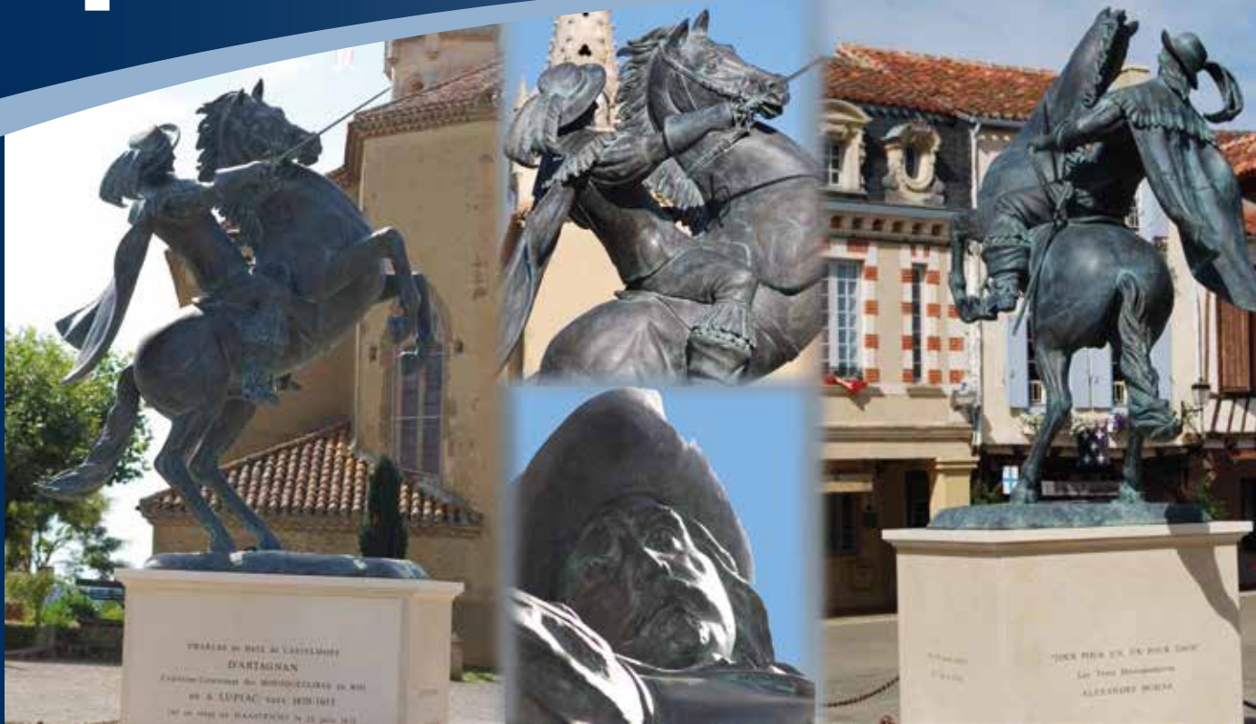
Oeuvre Daphné DU BARRY