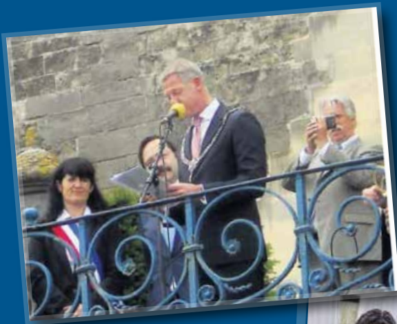
Maastricht, 25 juin

9 août Inauguration de la première statue équestre monumentale de d'ARTAGNAN