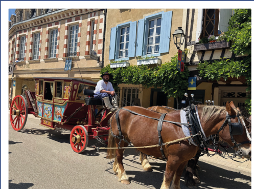
14 mai, Inauguration du carrosse