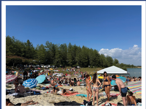
25 juillet, plage de Lacoste