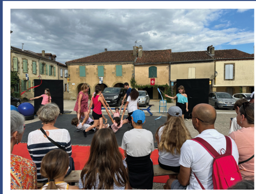
24 juillet, Spectacle EQUITPOP